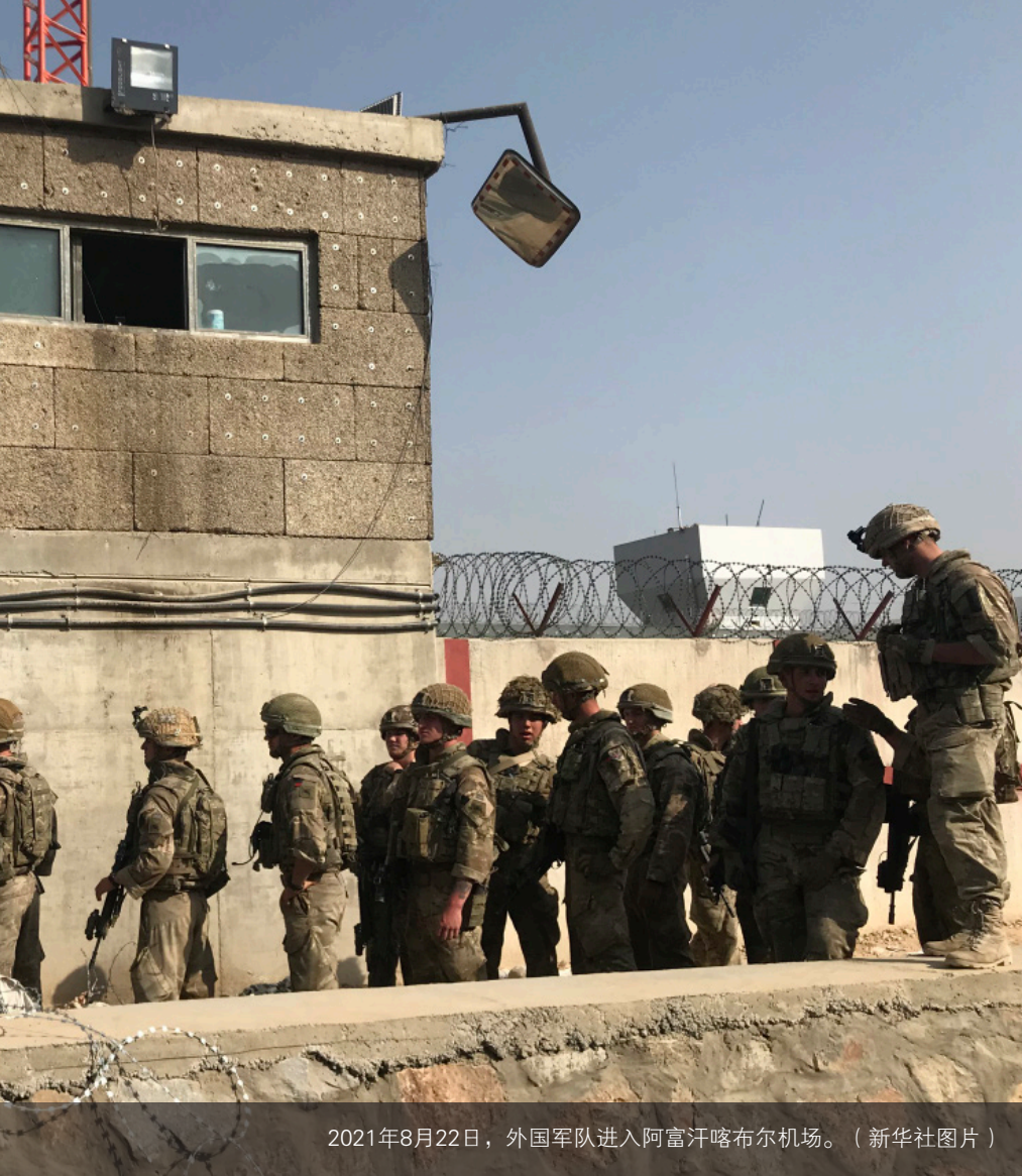
2021年8月22日，外国军队进入阿富汗喀布尔机场。

这些成分是：要求正本清源、返回真正的伊斯兰教；严格遵循《古兰经》和圣训，严格履行伊斯兰教法，清除伊斯兰教当中的非伊斯兰因素；通过这种途径，复兴伊斯兰国家和社会。