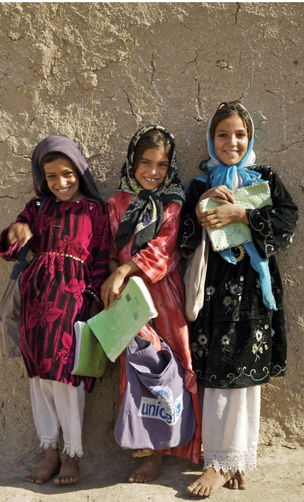
2021年8月9日，阿塔发言人扎比乌拉·穆贾希德表示，允许女性工作和学习，允许女性享有伊斯兰教原则范围内的所有权利。图为阿富汗女孩。